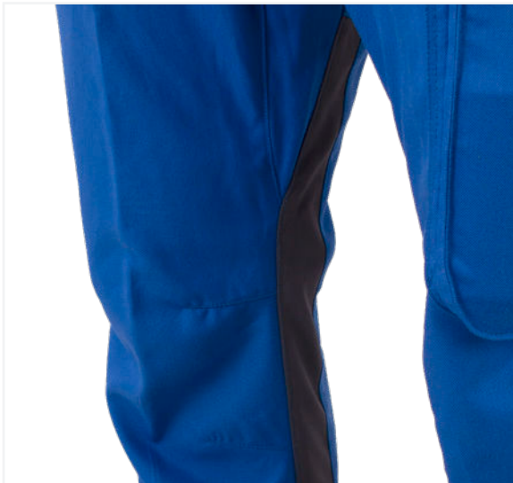
Graue Seiteneinsätze im Schrittbereich/ grey insertions at the side in the crotch