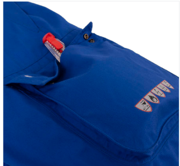
Oberschenkeltasche/ thigh pocket

MULTINORM LIGHTWEIGHT QUALITY WITH MAXIMUM COMFORT