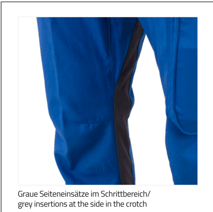
Graue Seiteneinsätze im Schrittbereich/ grey insertions at the side in the crotch