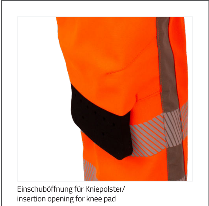
Einschuböffnung für Kniepolster/ insertion opening for knee pad