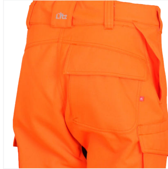
Echter Damenschnitt / Genuine women's cut