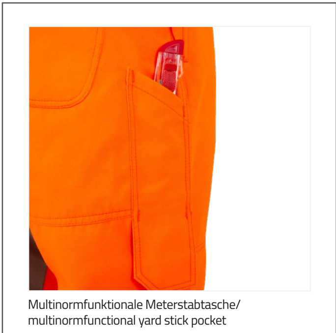
Multinormfunktionale Meterstabtasche/ multinormfunctional yard stick pocket