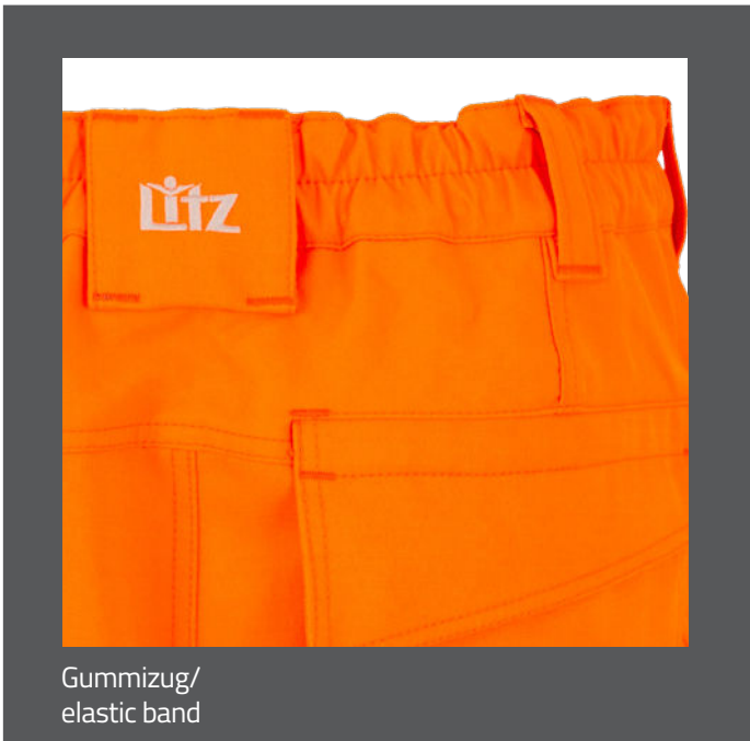
Gummizug/ elastic band