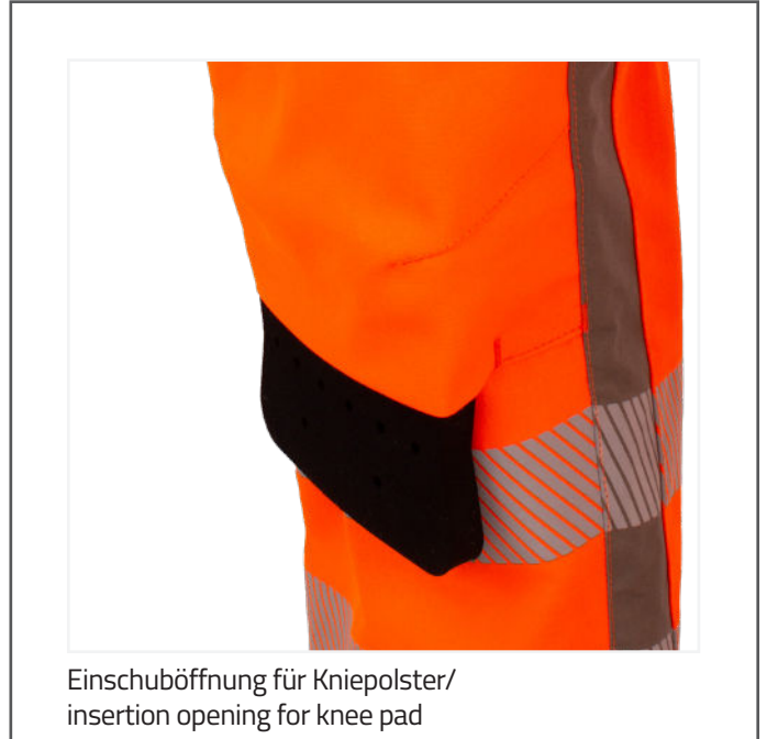
Einschuböffnung für Kniepolster/ insertion opening for knee pad