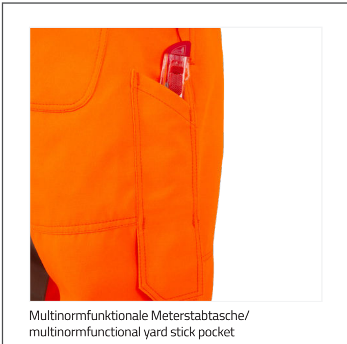
Multinormfunktionale Meterstabtasche/ multinormfunctional yard stick pocket