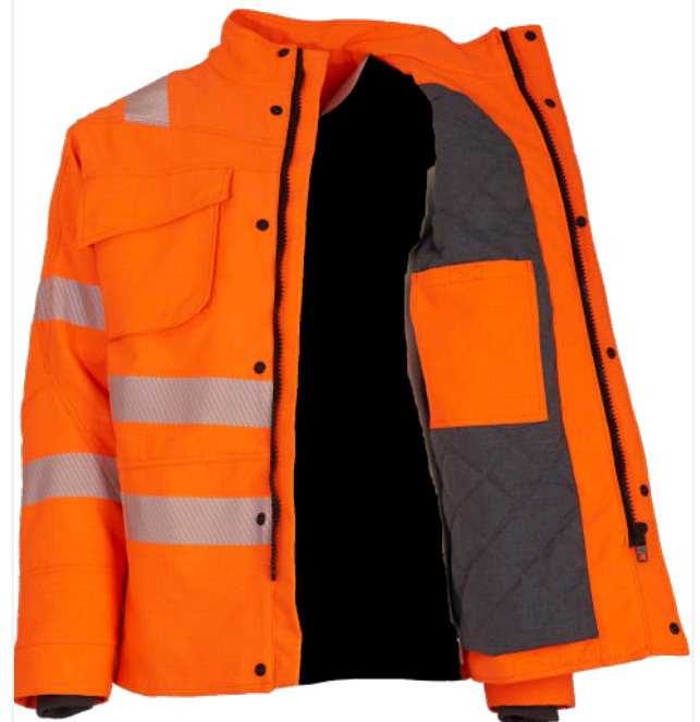
Eingearbeitetes Innensteppfutter/ integrated inner quilted lining