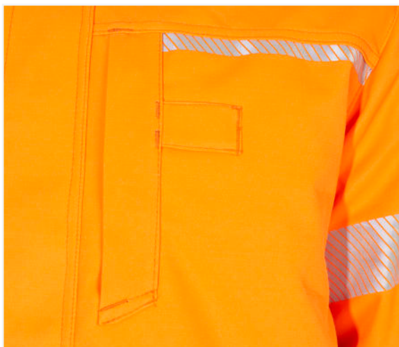
Napoleontasche mit Schlaufe für Funkgeräte oder Namensschild / napoleon pocket with loop for radio equipment or name tag