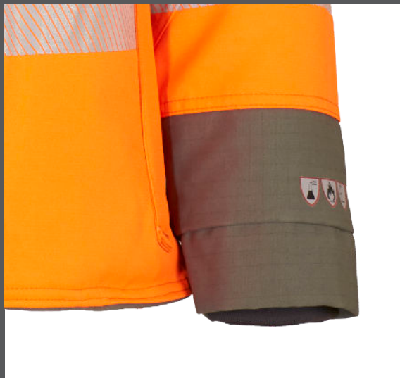
Piktogramme am Ärmelabschluss/ standards at the cuff