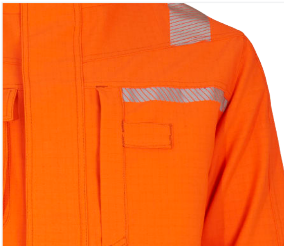
Napoleontasche mit Schlaufe für Funkgeräte oder Namensschild / napoleon pocket with loop for radio equipment or name tag