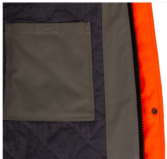
Eingearbeitetes Innensteppfutter/ integrated inner quilted lining